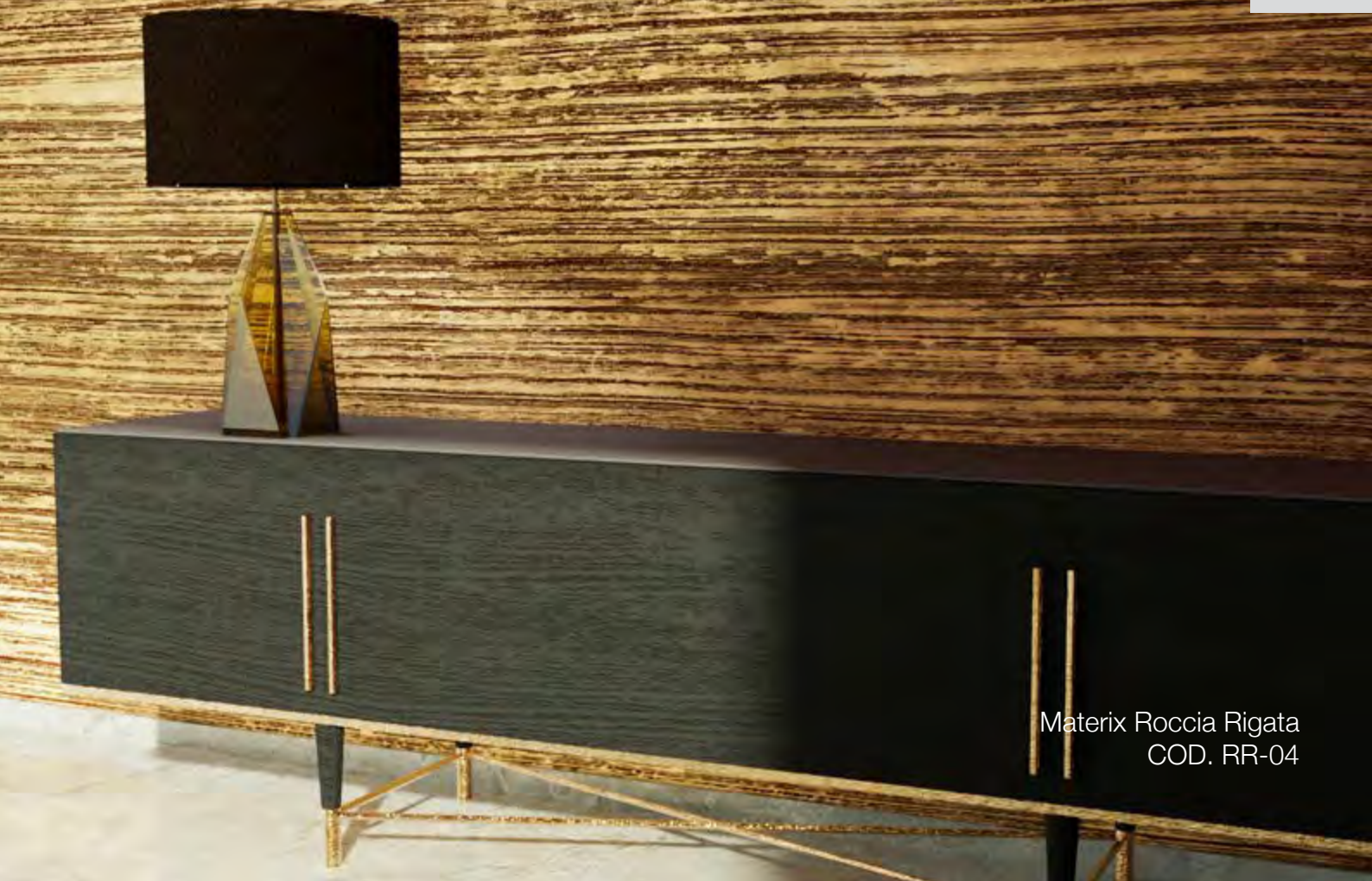
Materix Roccia Rigata COD. RR-04