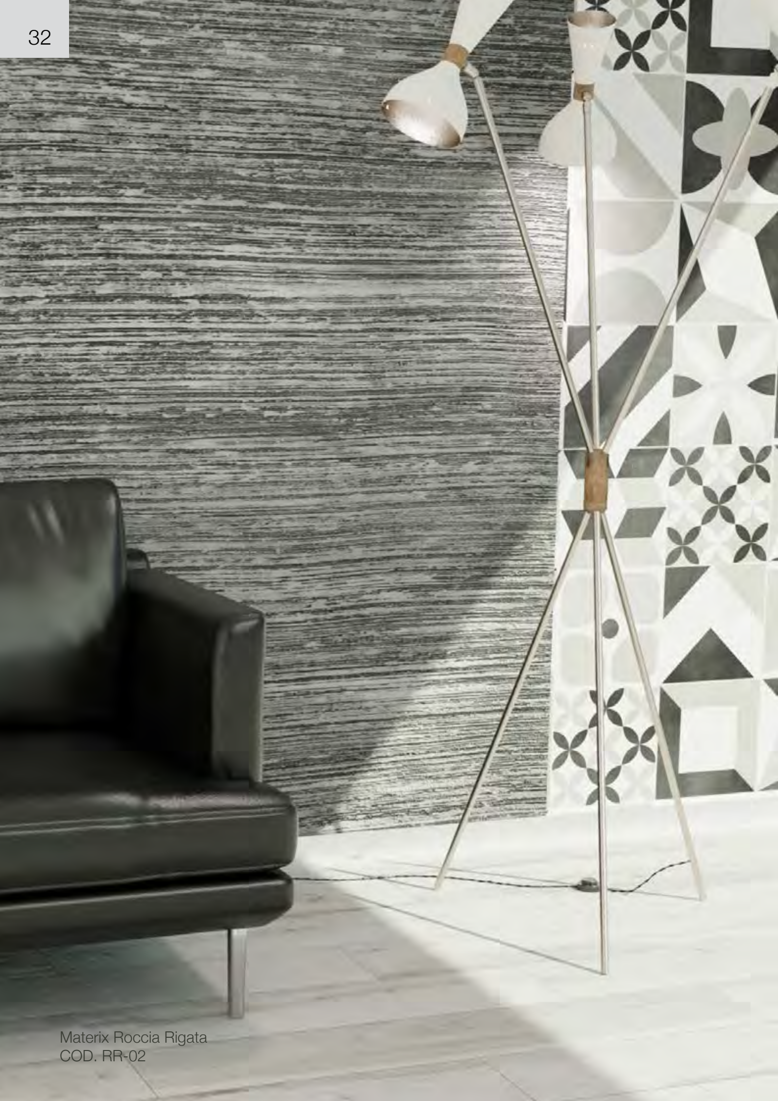
Matrix Roccia Rigata COD. RR-02