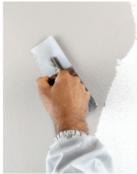
VeneziaT Erster Anstrich