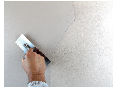
VeneziaT Zweiter Anstrich