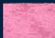
G-4° Argento 01