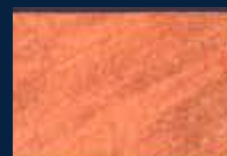
E-4° Argento 01