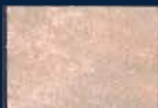
P-1° Argento 01