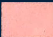
F-2° Argento 01