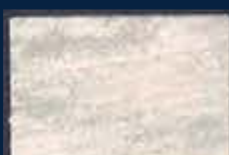
R-1° Argento 01