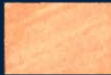
C-3° Argento 01