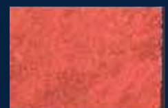
F-5° Argento 01