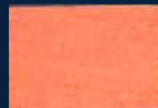
D-4° Argento 01