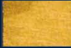
R-2° Oro 02