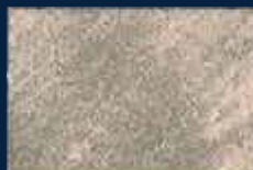
P-3° Alluminio 03