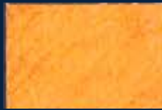
S-2° Oro 02