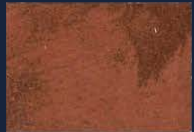
R-5° Rame 05