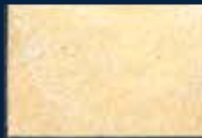
A-2° Argento 01