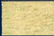
B-3° Alluminio 03