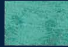
M-4° Argento 01