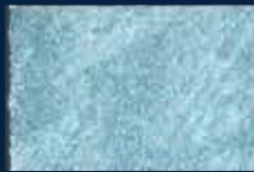
L-2° Alluminio 03