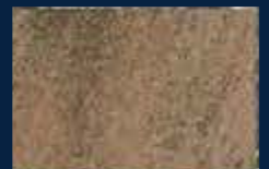
P-5° Alluminio 03