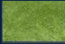
L-3° Oro 02