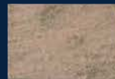
P-4° Argento 01