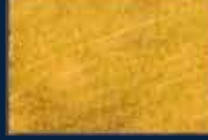
P-3° Oro 02