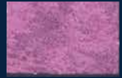
I-5° Argento 01