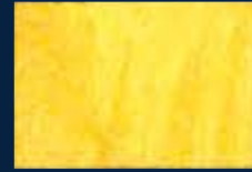
B-4° Argento 01