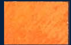
C-5° Argento 01