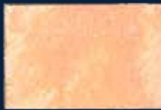
C-2° Argento 01