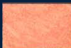
E-3° Argento 01