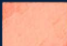
D-3° Argento 01