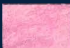
G-3° Argento 01