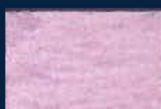
H-3° Argento 01