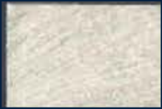
B-1° Alluminio 03