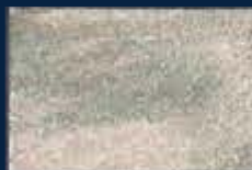
P-2° Alluminio 03