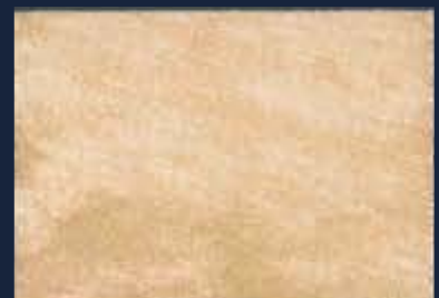
P-1° Iride Oro 428