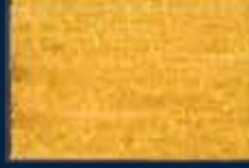
P-2° Oro 02