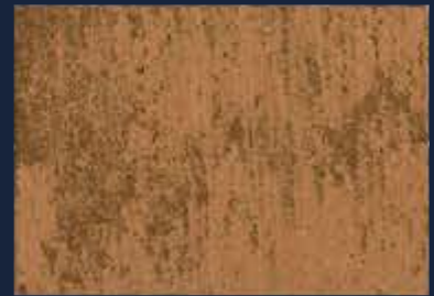
R-5° Bronzo 04