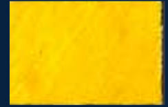
B-5° Argento 01