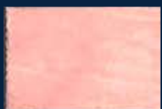
F-1° Argento 01