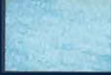
L-1° Argento 01