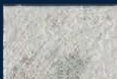
R-3° Alluminio 03