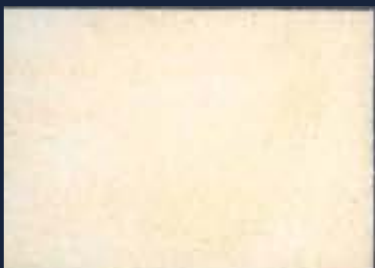
Iride Oro 428