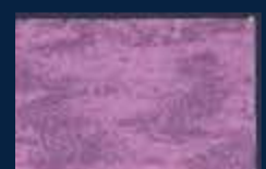
H-5° Argento 01