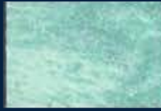
M-2° Argento 01