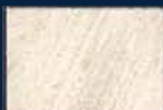
Q-1° Argento 01