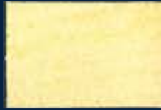
B-2° Argento 01