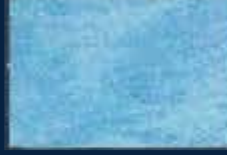
L-2° Argento 01