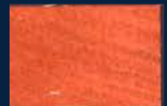
D-5° Argento 01