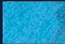
L-4° Alluminio 03