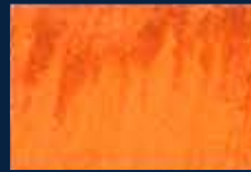
S-4° Oro 02