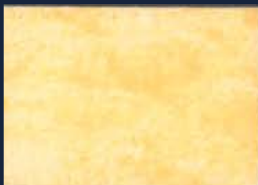
C-1° Iride Oro 428