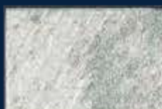
R-2° Alluminio 03