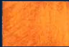
S-3° Oro 02