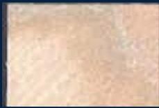
N-1° Argento 01