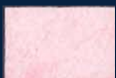
G-1° Argento 01