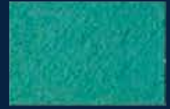
M-5° Argento 01