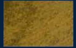
R-5° Oro 02