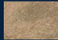
N-4° Argento 01