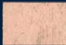
O-3° Argento 01