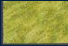
L-2° Oro 02