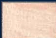
O-1° Argento 01