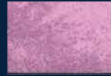
I-4° Argento 01