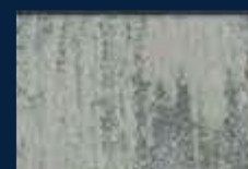
R-4° Argento 01