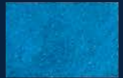
L-5° Alluminio 03