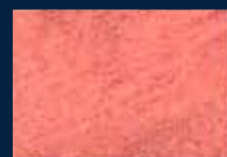
F-4° Argento 01