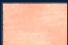
E-1° Argento 01