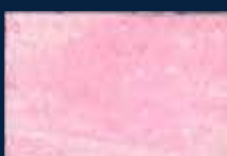
G-2° Argento 01