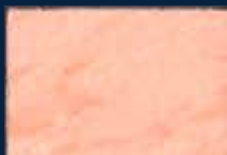
D-2° Argento 01