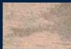
P-3° Argento 01