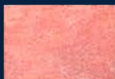
F-3° Argento 01