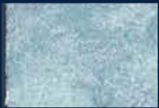
L-1° Alluminio 03