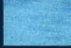
L-3° Argento 01