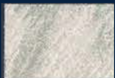
P-1° Alluminio 03