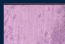
H-4° Argento 01