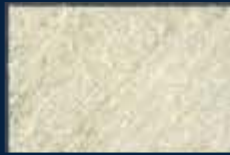
B-2° Alluminio 03