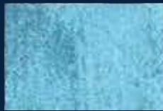
L-3° Alluminio 03