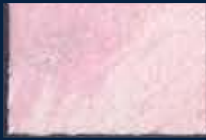
I-1° Argento 01