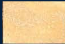
A-3° Argento 01