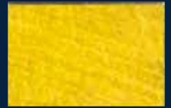
B-5° Alluminio 03