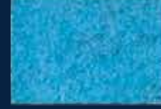
L-4° Argento 01