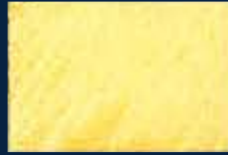
B-3° Argento 01