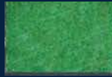
L-4° Oro 02