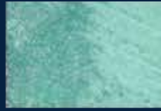
M-3° Argento 01