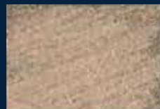
P-4° Alluminio 03