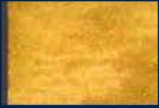
R-1° Oro 02