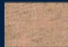
O-4° Argento 01