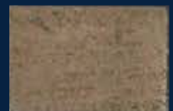
P-5° Argento 01