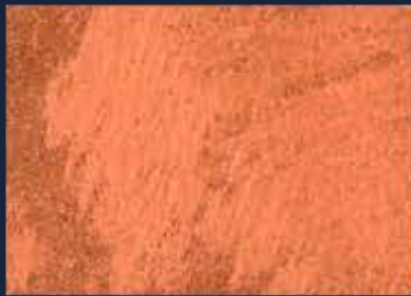
G-4° Bronzo 04