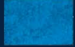
L-5° Argento 01