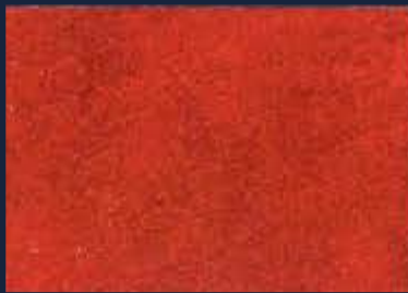
S-5° Rame 05