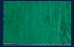
L-5° Oro 02