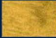
R-3° Oro 02