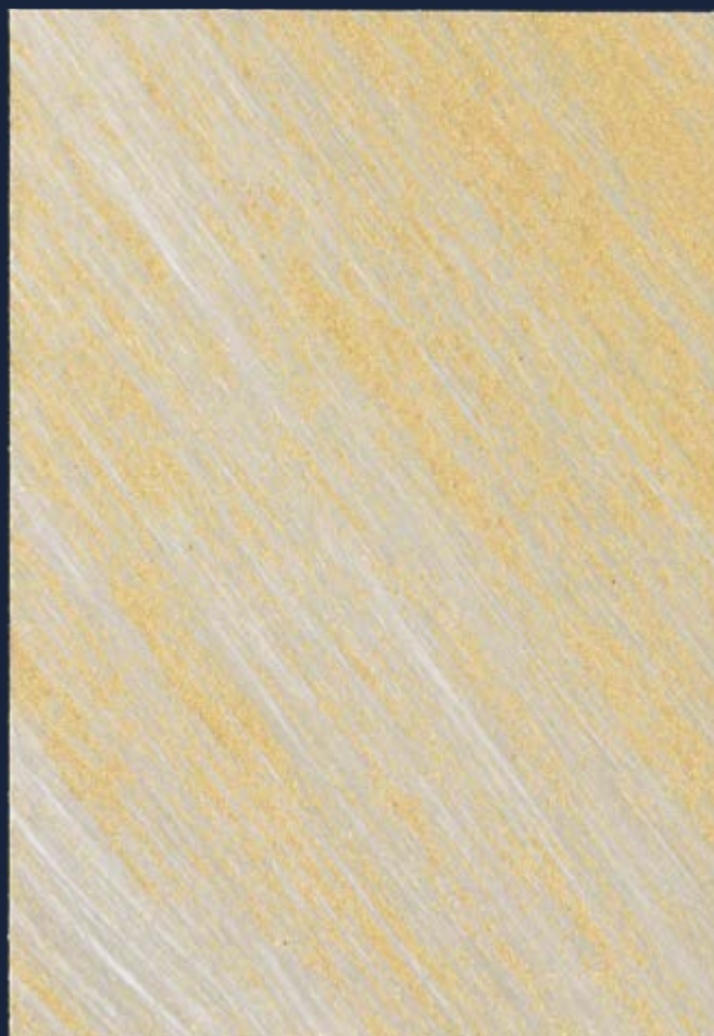
KALAHARI MEDIUM | P-1° Iride Oro 428