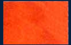
S-5° Oro 02