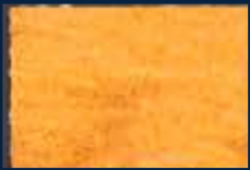
S-1° Oro 02