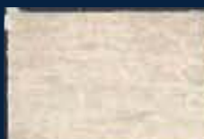
Q-2° Argento 01