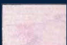
H-1° Argento 01