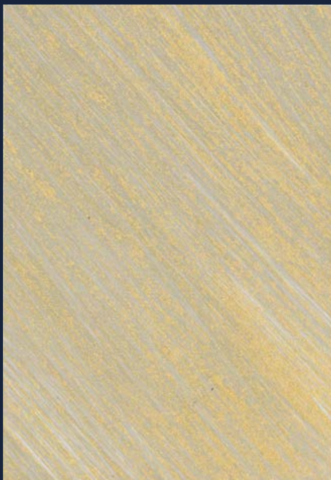
KALAHARI SMALL | P-1° Iride Oro 428