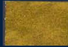
R-4° Oro 02