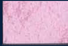
I-3° Argento 01