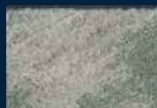
R-4° Alluminio 03