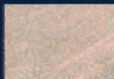
P-2° Argento 01