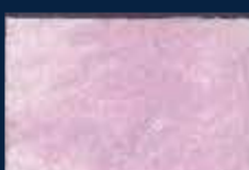
H-2° Argento 01