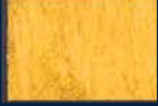
P-1° Oro 02