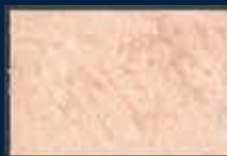
O-2° Argento 01