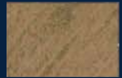
N-5° Argento 01