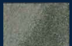
R-5° Alluminio 03