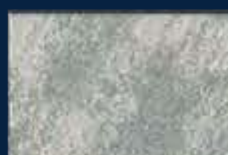
R-3° Argento 01