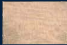
N-3° Argento 01