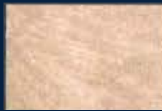
N-2° Argento 01