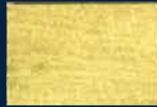
B-4° Alluminio 03