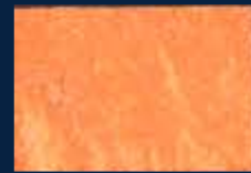
C-4° Argento 01