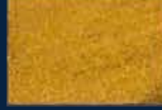
P-4° Oro 02