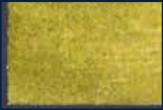
L-1° Oro 02