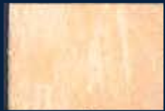
C-1° Argento 01