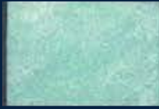
M-1° Argento 01