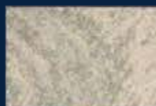
Q-3° Argento 01