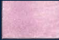
I-2° Argento 01