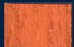
E-5° Argento 01