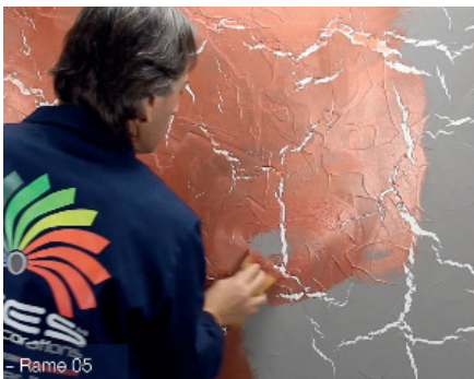
Kalahari micron Auftragen des ersten Anstrichs der ersten Farbe