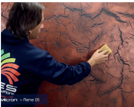
Kalahari micron Zweiter Anstrich mit der ersten Farbe