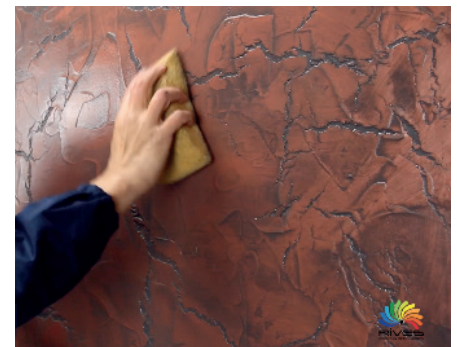
Shine (Waschen mit Wasser)