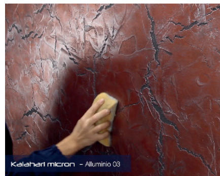
Kalahari micron Einen Anstrich der zweiten Farbe auftragen