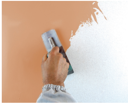
VeneziaG Erster Anstrich