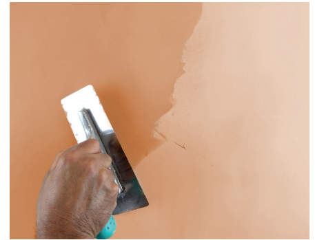
VeneziaG Zweiter Anstrich