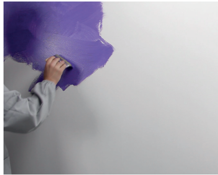
Seduxion Erster Anstrich