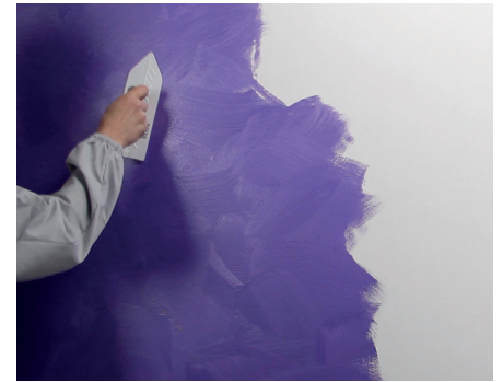
Smoothing Glätten mit Kunststoff-Spachtel