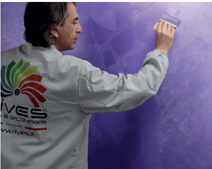
Seduxion Zweiter Anstrich