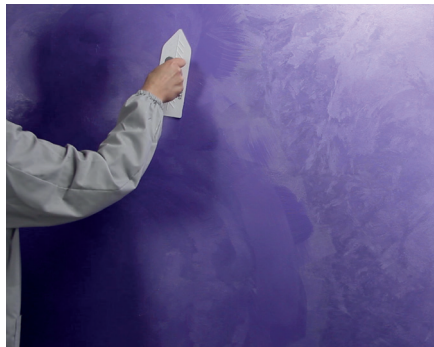
Smoothing Glätten zweiter Anstrich mit Kunststoff-Spachtel