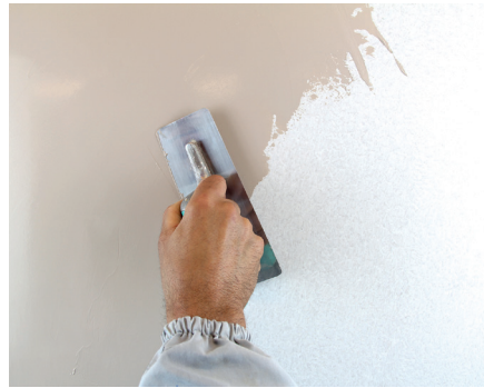
VeneziaV Erster Anstrich