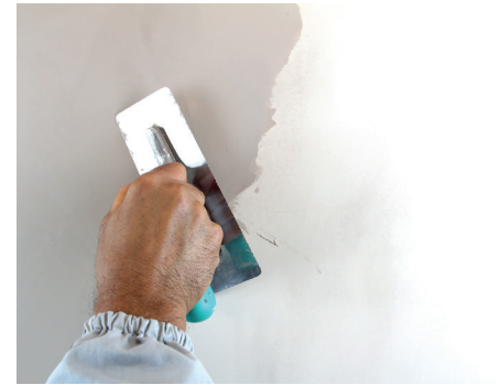
VeneziaV Zweiter Anstrich