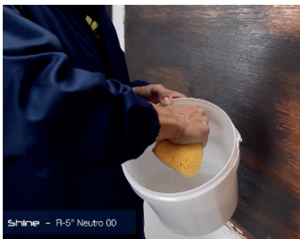
Shine (Waschen mit Wasser)