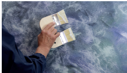
Marea aufgetragen mit Pennello Doppio Cod. S-PEN-L#D