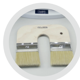
Pennello Doppio Cod. S-PEN-L#D